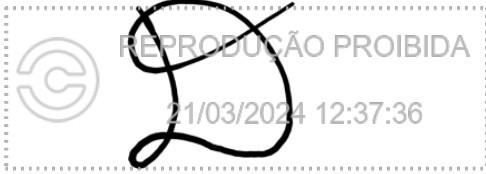
Daiana Campos Rodrigues 21 mar 2024, 12-37-36.png

Assinatura manuscrita com hash SHA256 prefixo 24447f(...)